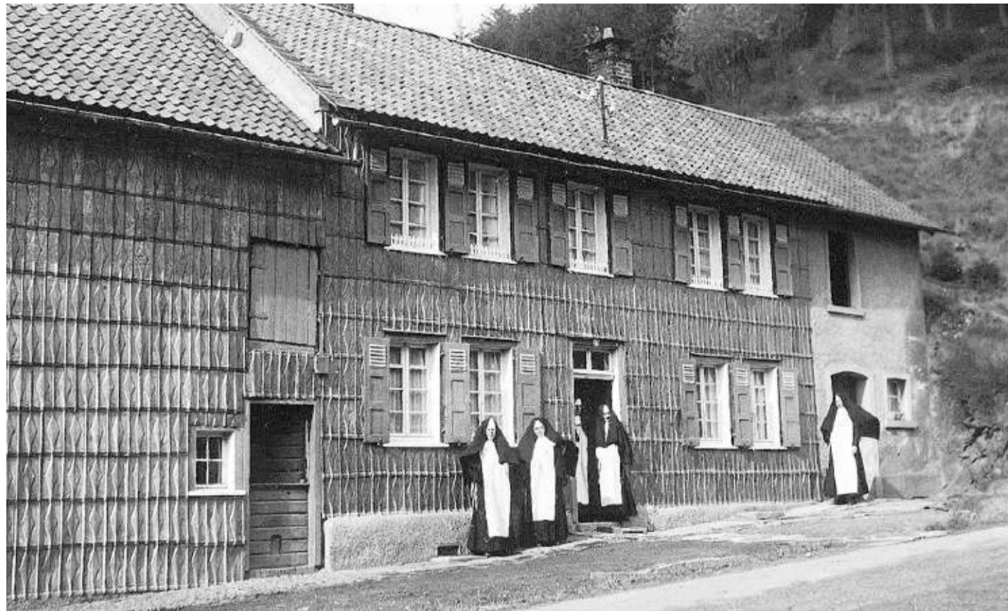
Im Haus Geisen, dem damaligen Sitz der Ordensschwester, war eine der Vorläufer-Schulen des heutigen Clara-Fey-Gymnasiums in Schleiden untergebracht.