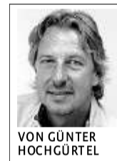
VON GÜNTER HOCHGÜRTEL

Erstaunlich an der ganzen Sache ist, dass zwar mindestens 170 000 Euro pro Jahr eingespart werden sollen, dass aber angeblich bei den freien Trägern alles viel besser wird. Glaubt einer ernsthaft, das DRK würde aus eigenen Mitteln die Ausstattung der früher städtischen Kindergärten optimieren? Das Geld, das dafür nötig ist, wird sich das DRK vom Land oder auch vom Kreis holen, und der wiederum bittet seine Kommunen zur Kasse. So etwas nennt man eine klassische Milchmädchen-Rechnung.